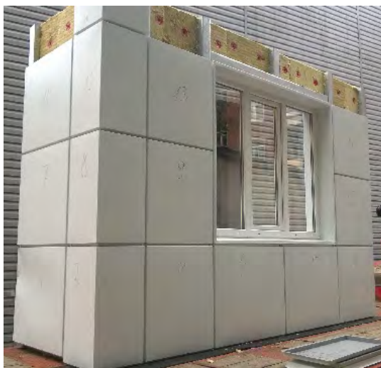
Рис. 2. Вид углового фрагмента блок-комнаты с установленным трехстворчатым оконным блоком с наружной стороны

инфильтрацией через фрагменты ограждающей конструкции, либо влагонакоплением в теплоизолирующих слоях.