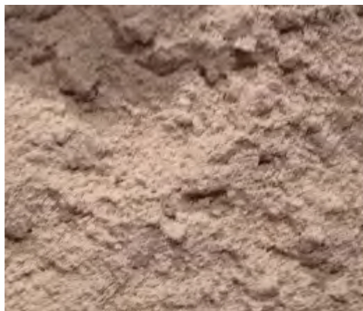
Rys. 2. Mączka chalcedonitowa

Do końcowej analizy wyrobów z autoklawizowanego betonu komórkowego, pod uwagę wzięte zostały cztery kryteria, takie jak: K1 - cena wyrobów, K2 - ekologia, K3 - średnia wytrzymałość na ściskanie, K4 - średni współczynnik absorpcji wody.