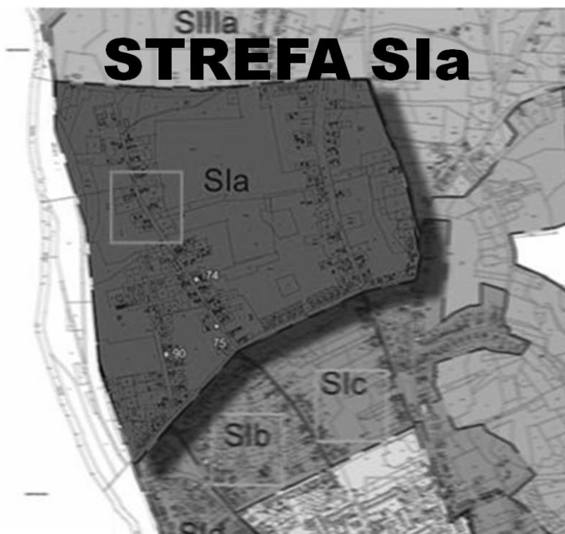
Rys. 2. Gubin. Mapa obszarów rewitalizowanych wg przyjętych kryteriów efektywności (opracowanie własne)

Poniżej przedstawiono jedną ze stref zabudowy mieszkaniowej wielorodzinnej w mieście Gubin, dla której przeprowadzono środowiskową ocenę parametryczną. Zabudowa pochodząca z lat 80. została wykonana w technologii wielkiej płyty. Przebieg badań był zgodny z przyjętą procedurą oceny środowiskowej metodą ASEET. Wybrano charakterystyczną zabudowę, w której dominuje określony pod względem architektonicznym typ budynków (wybrano obszar w zabudowie mieszkaniowej wielorodzinnej). Przestrzeń została sparametryzowana wg kryterium efektywności energetycznej i ekologicznej. Przyjęte w metodzie wskaźniki wiodące reprezentują podstawowe cechy środowiska zbudowanego na wybranym terenie. Poniżej przedstawiono grupę parametrów wiodących, reprezentujących wskazany obszar zurbanizowany w Gubinie.